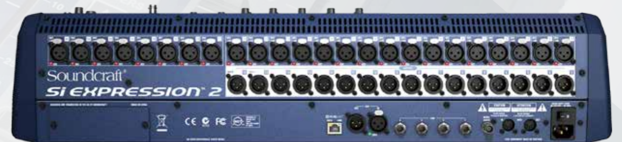
Si Expression 2 背面板