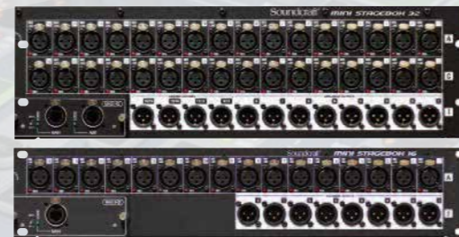
在 3U 的迷你舞台接口箱 32 和 2U 的迷你舞台接口箱 16 都包含了接口卡。

不能小视 Si Expression 小而不起眼，但在现实的使用中有精辟之处，链接一台迷你舞台接口箱 32(3U) 能增加 32 路话筒/线路输入，8 路模拟线路输出和 4 对 AES 输入输出，连上迷你舞台接口箱 16(2U) 能增加 16 路话筒/线路输入和 8 路线路输出，成为一个 16x8 I/O 扩展。这些舞台箱的连接不象某些数字调音台只是输入输出的分离，对 Si Expression 是一个提高。